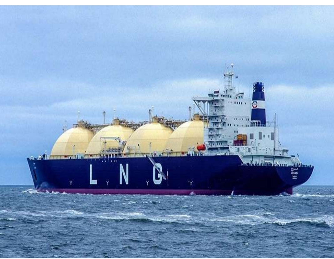
సీఎన్జీ, ఎల్సీ ఉత్పత్తి తొలి ప్రాధాన్యం ఇవ్వాలని ప్రభుత్వం ఆదేశించింది. వీటిని "ప్రయోరీటీ సెక్టార్-1"గా వర్గీకరించి, ఎల్సీ సరఫరా కోసం సాగించాలని స్పష్టం చేసింది. ఇంద్రం భద్రతకు సంబంధించి పరిస్థితిని నిరంతరం సమీక్షిస్తున్నామని, అవసరమైన అన్ని చర్యలు తీసుకుంటున్నామని కేంద్రం పేర్కొంది.