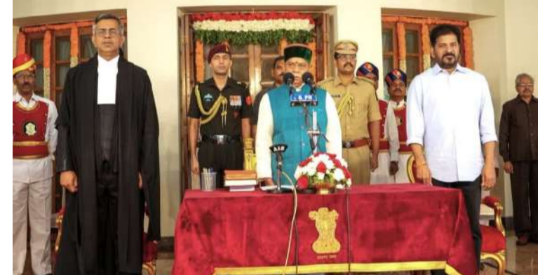
గవర్నర్ శివప్రతాప్ శుక్లా ఇంతకముందు హిమచల్ ప్రదేశ్ గవర్నర్ గా వ్యవహరించారు. తెలంగాణ గవర్నర్ గా ఉన్న జిట్టూర్ వర్మను మహారాష్ట్ర గవర్నర్ గా, తమిళనాడు గవర్నర్ ఆర్ఎన్ రవిని పశ్చిమ బెంగాల్ గవర్నర్ గా నియమించారు. ఈ మేరకు రాష్ట్రపతి మార్చి 5వ తేదీన సాయంత్రం ఉత్తర్రులు జారీ చేశారు. మరోవైపు పశ్చిమ బెంగాల్ గవర్నర్ సీఎ అనంద్ బోస్ రాజీనామాను కేంద్రం

మొదటివేళ తరువాయి - సహాయమంత్రిగా పని చేశారు. ఈయన విద్యాద్విగా ఉన్నప్పుడే ఏపీపీసీ సంస్థాగత కార్యదర్శిగా పని చేశారు. ఆ తర్వాత 1983లో బీజేపీలో చేరారు. 1989లో మొదటిసారి గోరఖేపూర్ సగర అసెంబ్లీ నియోజకవర్గం నుంచి జనతాపార్టీ తరఫున ఎమ్మెల్యేగా ఎన్నికయ్యారు. ఈ తర్వాత మళ్లీ 1991లో రెండోసారి ఎమ్మెల్యేగా గెలిచారు. నాలుగు సార్లు ఎమ్మెల్యేగా : యూపీలో మొదటిసారి కల్యాణసింగ్ నేతృత్వంలో ఎన్నికైన బీజేపీ ప్రభుత్వంలో విద్యాశాఖ సహాయమంత్రిగా స్వతంత్ర హోదాలో పని చేశారు. నాలుగు సార్లు 1993, 1996లలో ఎమ్మెల్యేగా ఎన్నికై విధులు నిర్వహించారు. 1996లో కల్యాణసింగ్, రామ్ ప్రకాశ్ గుప్తా, రాజనాథ్ ప్రభుత్వాల్లో మంత్రిగా పని చేశారు. 20 ఏళ్ల తర్వాత 2016 జూన్ 10వ తేదీన యూపీ రాష్ట్రం నుంచి రాజ్యసభకు ఎంపికయ్యారు. కేంద్ర ఆర్థిక శాఖ సహాయమంత్రిగా మోడి ప్రభుత్వంలో బాధ్యతలు తీసుకున్నారు. అలా ఎనిమిదేళ్లపాటు 2022 జూలై 5 వరకు రాజ్యసభ సభ్యుడిగా ఉన్నారు. మూడేళ్ల కిందట 2023 ఫిబ్రవరి 18న పామచిలో ప్రదేశ్ గవర్నర్ గా నియమితులయ్యారు. ఇప్పుడు తెలంగాణకు బదిలీ అయ్యారు.