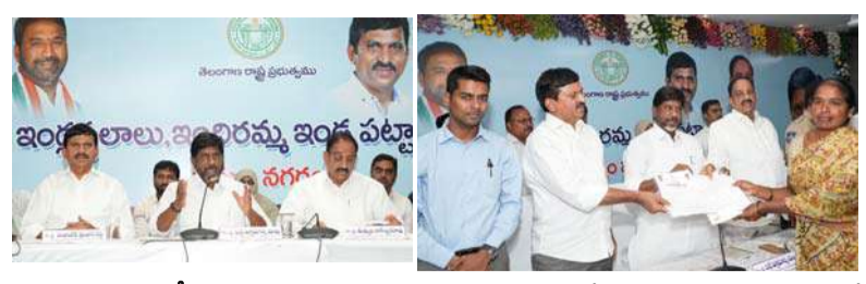
హైదరాబాద్ సీడీ ప్రతినిధి ( వార్త సంస్థ) మాన్య 11 : నగరంలో వెలుగుమట్ల భూదాన్ భూమిలో అర్బులకు ఇళ్ల స్థలాలు, ఇందిరమ్మ ఇండ్ల పట్టణ పంటిటి వెలుగుమట్ల రెవెన్యూ పరిధిలోనే వకాగా స్థలాలు తో పాటు ఇందిరమ్మ నిర్మాణ మంజూరు పత్రాలు అందచేత. మొత్తం 412 మందికి లభి

ఖమ్మం కలెక్టర్ కార్యాలయం లో ముగ్గురు మంత్రులు డిప్యూటీ సీఎం భట్టి విక్రమార్క వ్యవసాయ శాఖ మంత్రి తుమ్మల నాగేశ్వరరావు, రెవెన్యూ శాఖ మంత్రి పాంగులటి శ్రీనివాసరెడ్డి బృందం..