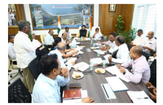
సింగూర్ డ్యామ్ ను సందర్శిస్తూ భూసేకరణకు 5000 కోట్లు జూన్ 2 నాటికి భూసేకరణ పూర్తి

పాలెం వారు ప్రాజెక్ట్ గేట్లు, రెగ్యులేటర్ల సమస్యలను పరిష్కరిస్తూ ప్రాజెక్ట్ పరిస్థితిని క్షేత్రస్థాయిలో వెళ్లె సమీక్షించండి అధికారులకు అదేశాలు - మంత్రి ఉత్తమ్ కుమార్ రెడ్డి