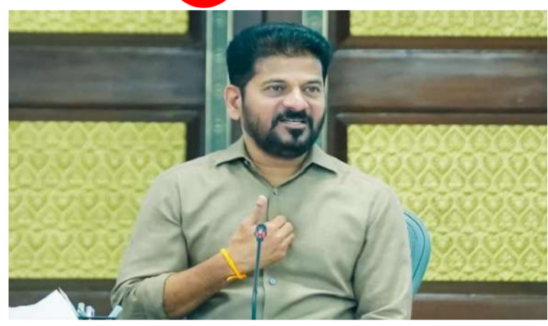
వార్త సంధ్య హైదరాబాద్, మార్చి 04 : రాష్ట్రంలో సుమారు 25 వేల మంది బోగన్ ఉద్యోగులు ఉన్నారని, వారంతా కనీసం ఆధార్ కార్డు కూడా లేకుండా ఏళ్లుగా జీతాలు తీసుకుంటున్నారని సీఎం రేవంత్ రెడ్డి సంచలన విషయం వెల్లడించారు. రాష్ట్రవ్యాప్తంగా వివిధ శాఖల్లో ఉన్న 1.70 లక్షల మంది ఔట్సోర్సింగ్, కాంట్రాక్టు ఉద్యోగుల్లో ఈ నకిలీ ఉద్యోగులను గుర్తించి తొలగించాలని తెలిపారు. ఇలాంటి బోగన్ ఉద్యోగులను సృష్టించి ప్రభుత్వ ధనాన్ని దుర్వినియోగం చేస్తున్న ఔట్సోర్సింగ్ ఏజెన్సీలపై - మగతా 2 లో