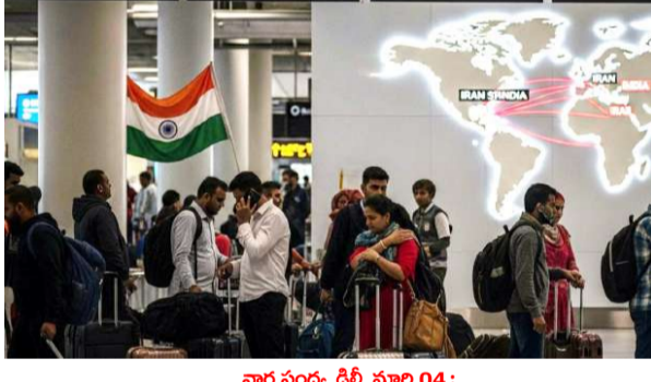
వార్త సంధ్య ఢిల్లీ, మార్చి 04 : మధ్యప్రాచ్యంలో అమెరికా, ఇజ్రాయేల్, ఇరాన్ మధ్య పెరుగుతున్న ఉద్రిక్తతల నేపథ్యంలో గల్ఫ్ రేకాల్డ్ విమానాలను భారతీయులను స్వదేశానికి తరలించేందుకు భారత విమానయాన సంస్థలు భారీ ఆపరేషన్ చేపట్టాయి. ఇవాళ ఒక్కరోజే 58 ప్రత్యేక విమానాలను నడుపుతున్నట్లు కేంద్ర పౌర విమానయాన మంత్రిత్వ శాఖ అధికారికంగా ప్రకటించింది. ఇందులో ఇండిగో 30 విమానాలను, ఎయిర్ ఇండియా, ఎయిర్ ఇండియా ఎక్స్ప్రెస్ కలిపి 23 విమానాలను నడపనున్నాయి. సర్జిమన్యూలోని చాలా దేశాలు తమ గగనతలాన్ని మూసివేయడం లేదా కఠిన ఆంక్షలు విధించడంతో వేలాది మంది ప్రయాణికులు తీవ్ర ఇబ్బందులు - మగతా 2 లో