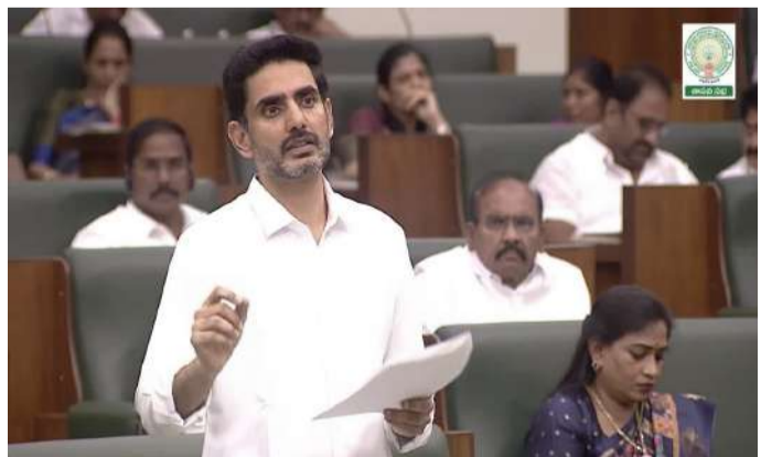
వార్త సంధ్య అమరావతి, మార్చి 04 : విద్యా రంగంలో రాష్ట్ర ప్రభుత్వం చేపట్టిన సంస్కరణలు ఇతర రాష్ట్రాలకు ఆదర్శంగా నిలిచాయని మంత్రి నారా లోకేశ్ అన్నారు. అలానే ఆంధ్రా మోడల్ అవ్ ఎడ్యుకేషన్ ప్రపంచానికి చూపిస్తాయని తెలిపారు. పాఠశాల విద్యాశాఖ బడ్జెట్ రూ.32,308 కోట్లు, ఉన్నత విద్యాశాఖ రూ.2,566 కోట్ల బడ్జెట్ డిమాండ్లపై మంత్రి అసెంబ్లీలో మాట్లాడారు. 2019-24 మధ్య విద్యాశాఖలో తీవ్ర విధ్వంసం జరిగిందని, 10 లక్షల మంది విద్యార్థులు ప్రభుత్వ బడులకు దూరమయ్యారని మండిపడ్డారు. అన్ని సెక్షన్లలోనూ విద్యార్థుల్లో ప్రమాణాలు దారుణంగా పడిపోయాయని, అక్షరాస్యత విషయంలో ఏపీని అట్టడుగు స్థానానికి చేర్చారని దుయ్యబట్టారు. ఐటీ, సీఐఎన్ఈ నిలబెట్టిన - మగతా 2 లో