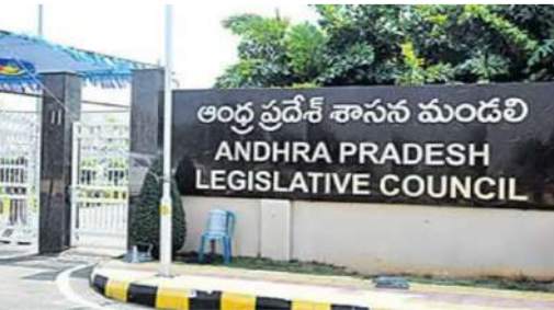
వార్త సంధ్య అమరావతి, మార్చి 04 : ఆంధ్రప్రదేశ్ శాసనమండలి రెండు కీలకమైన బిల్లులకు ఆమోదం తెలిపింది. అసైన్డ్ భూముల చట్ట నవరణ బిల్లు, ఏపీ గ్రామ, వార్డు సచివాలయాల పునర్వ్యవస్థీకరణ బిల్లులను మండలి ఆమోదించింది. - మగతా 2 లో