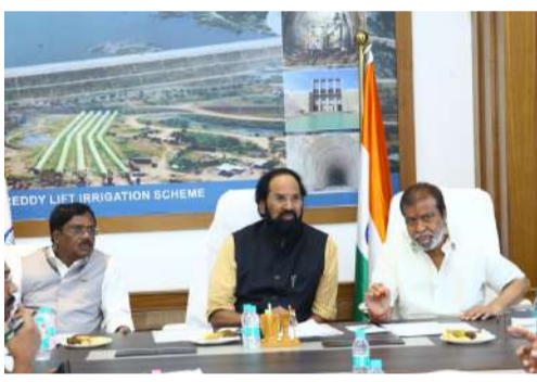
సింగూర్ డ్యామ్ ను సందర్శిస్తూ భూసేకరణకు 5000 కోట్లు జూన్ 2 నాటికి భూసేకరణ పూర్తి

స్వయంగా డ్యామ్ ను సందర్శిస్తూ భూసేకరణకు 5000 కోట్లు జూన్ 2 నాటికి భూసేకరణ పూర్తి