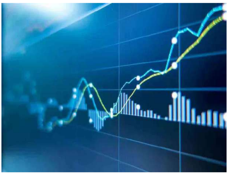
ముది చమురు ధరలు, ఇతర అంతర్జాతీయ పరిణామాలూ కీలకమే. కాగా, అమ్మకాల ఒత్తిడి కనిపిస్తే నిస్సెక్స్ 25,800 పాయింట్ల స్థాయి కీలకమైనదనుకోవచ్చు. దీనికి దిగువన ముగిస్తే 25,600 పాయింట్ల

తీవ్ర ఒడిదుడుకుల నడుమ దేశీయ స్టాక్ మార్కెట్లు గత వారం స్వల్ప లాభాల్లోనే ముగిశాయి. అంతకుముందు వారం ముగింపుతో చూస్తే.. సెన్సెక్స్ 112.09 పాయింట్లు పడిపోయి 85,041.45 డగ్గర నిలిచింది. నిస్సెక్స్ 75.90 పాయింట్లు దిగజారి 26,042.30 వద్ద స్థిరపడింది. ఇక ఈ వారం విషయానికొస్తే.. దేశ, విదేశీ ప్రతికూల పరిస్థితులతో మదుపరులు అమ్మకాల ఒత్తిడికి లోనుకావచ్చును అంచనాలు ఎక్కువగా ఉన్నాయి. ఫారెన్ మార్కెట్లో డాలర్లతో పోటీలో రూపాయి మారకం విలువ కాస్త కొలుకుండుతున్నట్లు కనిపిస్తున్నా.. ఇంకా ఆల్ట్రెమ్ కనిష్ట స్థాయి దరిదాపుల్లోనే కొట్టుకుంటున్నట్లు. ఈ క్రమంలో మళ్లీ నష్టాలకు లోకేనే మార్కెట్ సెంటిమెంట్ దెబ్బతింపవచ్చు. అయితే ఇన్వెస్టు కొనుగోళ్లకు మద్దతిస్తే.. సూచీలు లాభాల్లో పరుగులు తీయవచ్చు. ఇక ఎప్పట్లో గ్లోబల్ స్టాక్ మార్కెట్ల తీరుతున్నాయి. విదేశీ మదుపరుల పెట్టుబడులు,