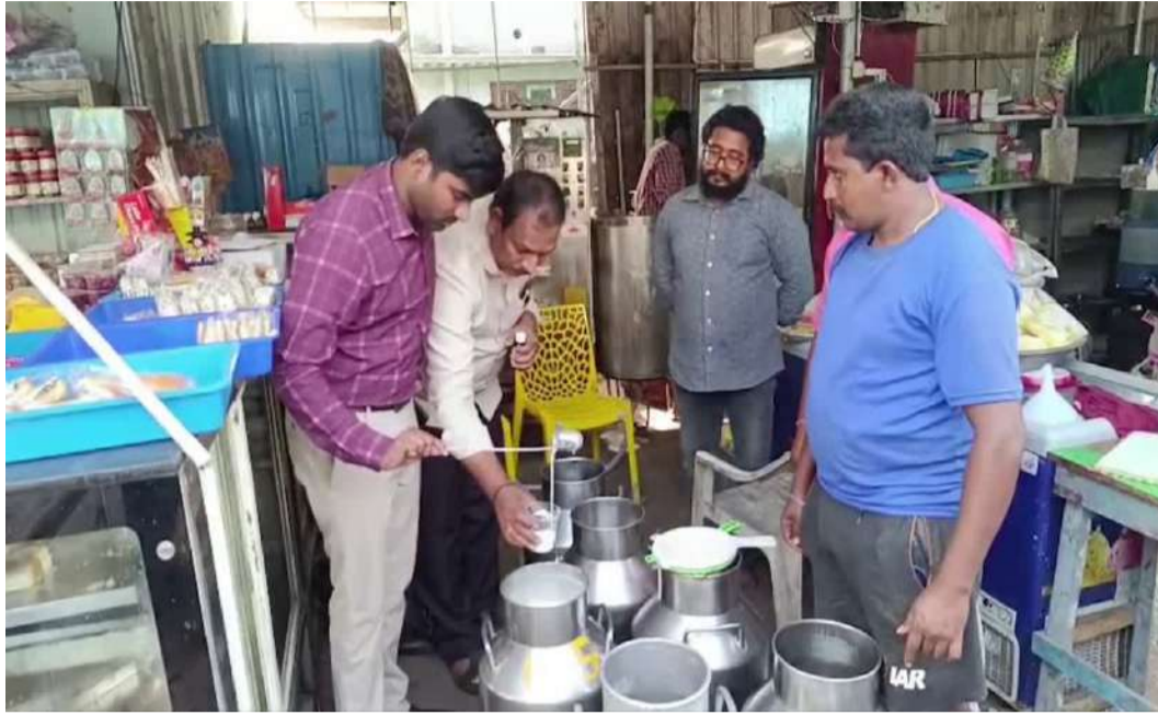
ప్రాంతాల్లో పాలను విక్రయించకూడదని వ్యాపారులకు సూచించాం.

పాల సమూహాలను సేకరించి ల్యాబ్స్ కు తరలింపు, ప్రాజెక్ట్ నిల్వ ఉంచిన బాదం పాల ప్యాకెటింగు సైతం గుర్తించిన అధికారులు. రాజమహేంద్రవరం కట్టి పాల ఘటన రాష్ట్ర వ్యాప్తంగా కలకలం రేపిస్తోంది. ఈ నేపథ్యంలో రాష్ట్రవ్యాప్తంగా పాల విక్రయ కేంద్రాలపై ఫుడ్ సేఫ్టీ అధికారులు తనిఖీలు నిర్వహిస్తున్నారు. కృష్ణాజిల్లా మచిలీపట్నంలో పాల కేంద్రాలపై అధికారులు విస్తృత తనిఖీలు చేపట్టారు. రాజమండ్రి కట్టి పాల ఘటన మరొక్కా వున్నావుతం కాకుండా ఫుడ్ సేఫ్టీ అధికారులు విస్తృత స్థాయిలో ముమ్మర తనిఖీలు చేపట్టారు.మచిలీపట్నం జిల్లా పరిషత్ సెంటర్, చిలకలపూడి సెంటర్ లోని పాల కేంద్రాలలోని పాలు తనిఖీ చేశారు అనంతరం మచిలీపట్నంలో చిలకలపూడి ప్రాంతంలో ఎస్.ఎస్. మిల్క్ జిల్లా పరిషత్ కృష్ణవేణి మిల్క్ డెబ్రి పాల కేంద్రాల నుంచి పాల సమూహాలను సేకరించి ప్రయోగశాలకు పంపారు. ఎమ్మార్సీపీ, మ్యానుఫ్యాక్చరింగ్ డేట్ లేని, అత్యధిక కాలం ప్రాజెక్ట్ నిల్వ ఉంచిన బాదం పాల ప్యాకెటింగు సైతం అధికారులు గుర్తించారు.