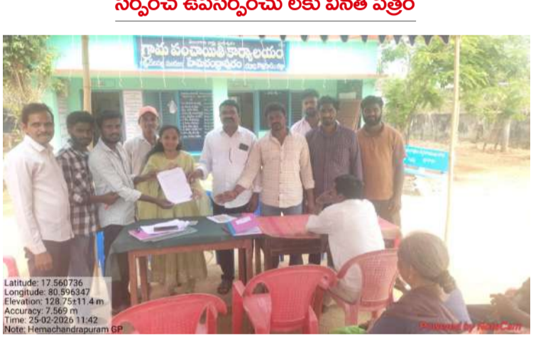
సర్పంచ్ ఉపసర్పంచు లకు వినితీ పత్రం

లక్ష్మీవేపల్లి మండలం, ఫిబ్రవరి 25 (వార్త సంస్థ) : లక్ష్మీవేపల్లి పల్లె మండలం యువచంద్రపురం పంచాయతీలో బుధవారం గ్రామపంచాయతీ కార్యాలయంలో సర్పంచ్ గారు, ఉప సర్పంచ్ గారు మరియు వార్డు సభ్యుల ఆధ్వర్యంలో గ్రామ సభ కార్యక్రమం నిర్వహించారు. ఈ గ్రామ సభలో వార్డు తో పాటు ఇతర వార్డులలో ఉన్న పలు సమస్యలను గ్రామ పాలకవర్గ దృష్టికి తీసుకువచ్చి వినితీ పత్రం సమర్పించిన గ్రామ యువత, వారు మాట్లాడుతూ గ్రామ అభివృద్ధికి సంబంధించిన మౌలిక సదుపాయాలు, తాగునీరు, డ్రైనేజీ, రహదారులు తదితర అంశాలపై చర్చించారు. మిషన్ భగీరథం పైపులైను లీకేజీకి గురై పల్లెపూరు నీరు రోడ్డుపై నిలువ ఉంటుందని ఆవేదం వ్యక్తం చేశారు. ఇంకా కొన్నిచోట్ల విద్యుత్ సౌఖ్యం ఏర్పాటు చేస్తే గ్రామం కొంచెం వెలుతురుగా కనిపిస్తోందని తెలిపారు. ఈ కార్యక్రమంలో గ్రామ యువత సైతం చురుకుగా పాల్గొని తమ అభిప్రాయాలు వ్యక్తం చేయడం విశేషం. గ్రామభివృద్ధికి యువత సహకారం ఎంతో అవసరమని సభలో పలువురు అభిప్రాయపడ్డారు.