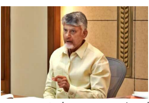
వెల్లాయని అన్నారు. గతంలో తాను ముఖ్యమంత్రిగా కొనసాగి ఉండే 2021లోనే ప్రాజెక్టు పూర్తి చేసే నీళ్లు ఇచ్చేవాళ్లమని వెల్లడించారు. గత పాలకుడు పనులు పూర్తి అయ్యాయని డౌంగ్ నాలుకాలు అడారని, పనులు పూర్తి చేయకుండానే జాతికి అతికం చేశారని విమర్శించారు. నిజంగానే ప్రాజెక్టు పనులు పూర్తి అయి ఉంటే ఇప్పుడు నేను రావాల్సిన అవసరమే ఉండేది కాదని పేర్కొన్నారు.

మొదటిపేజీ తరువాయి - ప్రజల హక్కులరక్షణ మధ్య ఆయన ప్రసంగించారు. వచ్చే ఎన్నికల్లో ప్రకాశం, మార్కాపురం జిల్లా అంతా కూటమిని వంద శాతం గెలిపించాలని కోరారు. 150 కిలోమీటర్లు ప్రయాణించి ఒంగోలుకు వెళ్లాలని ఇబ్బందిని తొలగిస్తూ మార్కాపురం జిల్లాను ఏర్పాటు చేసే మాట నిలబెట్టుకున్నామని అన్నారు. మార్కాపురం జిల్లా మదనపల్లి జిల్లా, అలాగే పోలవరం జిల్లాను కూడా ఏర్పాటు చేశామని అన్నారు. వెనుకబడిన ప్రాంతాలు నీరు, సౌకర్యాలు లేక ఇబ్బందులు పడారని, మార్కాపురానికి మరో వరంగా వెలిగించే ప్రాజెక్టును పూర్తి చేసే నీరు అందిస్తామని హామీ ఇచ్చారు. గతంలో ఈ ప్రాజెక్టుకు తానే శంకుస్థాపన చేశానని, అదే ప్రాజెక్టు పూర్తి చేయడానికి ఇప్పుడు తనకు అవకాశం వచ్చిందని అన్నారు. 2019-24 మధ్య రాష్ట్రానికి చీకటి రోజులు అని వ్యాఖ్యానించారు. వెలిగించే ప్రాజెక్టు ఒక్క అడుగు పడలేదని అన్నారు. ఈ ప్రాజెక్టును నిర్మిస్తే 4.35 లక్షల ఎకరాలు సాగులోకి వస్తాయని, గిద్దలూరు, ఎర్రగోడపాఠం, కనిగిరి లాంటి నియోజవర్గాలతో పాటు ఉదయగిరి, కడప, బద్వేలుకు కూడా నీరు