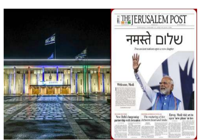
తొలివార్త, ఢిల్లీ, ఫిబ్రవరి 25 : ప్రధాని నరేంద్ర మోదీ తన ఇజ్రాయెల్ పర్యటనపై స్పందిస్తూ, ఈ పర్యటన ఇరు దేశాల మధ్య ద్వైపాక్షిక సంబంధాలను మరింత బలోపేతం చేస్తుందన్న పూర్తి విశ్వాసాన్ని వ్యక్తం చేశారు. 2017 తర్వాత మోదీ ఇజ్రాయెల్ లో పర్యటించడం ఇది రెండోసారి. ఈ పర్యటన చారిత్రకమని, ఇరు దేశాల స్నేహానికి కొత్త ఉత్తేజాన్ని ఇస్తుందని ఆయన అభివర్ణించారు. మోదీ పర్యటన సందర్భంగా ఇజ్రాయెల్ ఘన స్వాగతం పలికింది. "ప్రధాని మోదీకి స్వాగతం పలకడానికి ఇజ్రాయెల్ మొత్తం ఉత్సాహంగా ఉంది. ఆయన ఇజ్రాయెల్ కు నిజమైన స్నేహితుడు" అని ఆ దేశ ప్రతిపక్ష నేత యాయీర్ లాపిడ్ పేర్కొన్నారు. దీనికి తోడు, మోదీ గౌరవార్థం ఇజ్రాయెల్ పార్లమెంట్ 'నెస్సెట్' భవనాన్ని మంగళవారం రాత్రి భారత త్రివర్ణ పతాక రంగులతో దేదీప్యమానంగా అలంకరించారు. ఈ గౌరవానికి మోదీ ధన్యవాదాలు తెలుపుతూ, నెస్సెట్ లో ప్రసంగించేందుకు - మిగతా 2 లో