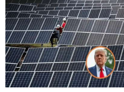
భారత్ ప్రస్తుతం అమెరికాకు సోలార్ ప్యానెల్స్ ఎగుమతి చేయడంలో కీలక పాత్ర పోషిస్తోంది. ఈ 126% దూర్ణం వల్ల భారతీయ కంపెనీల ఉత్పత్తులు అమెరికాలో వివేకంగా ప్రియం కానున్నాయి. దీనివల్ల అర్థం తగ్గిపోయే ప్రమాదం ఉందనే ఆందోళనలు వ్యక్తమవుతున్నాయి.

మోపింది. ఈ మామ దేశాల నుంచి అమెరికాకు సుమారు 4.5 బిలియన్ డాలర్ల విలువైన సోలార్ ఉత్పత్తులు దిగుమతి అవుతున్నాయి. భారత ప్రభుత్వం తన సోలార్ పరిశ్రమలకు అడ్డంకంగా సర్టిఫైడ్ ఇన్వోయిస్, దీనివల్ల అమెరికాలోని స్థానిక కంపెనీలు సప్లయ్ చేయాలని వాణిజ్య శాఖ వాదిస్తోంది. అందుకే 'కాంటి' వెలింగ్ దూర్ణం పేరుతో ఈ బాధను మోలుతున్నాం. సుప్రీం తీర్పును వ్యతిరేకిస్తూ.. ట్రంప్ విధించిన సాధారణ సంకాలను రద్దు చేస్తూ అమెరికా సుప్రీంకోర్టు ఇటీవల తీర్పు వెలువరించింది. అయినప్పటికీ ట్రంప్ వెనక్కి తగ్గుకుండా "విచేసే సర్టిఫైడ్" సాకుతో కేవలం కొన్ని రంగాలనే లక్ష్యంగా చేసుకుని ఈ కొత్త ఉత్తర్వులు జారీ చేయడం గమనార్హం.