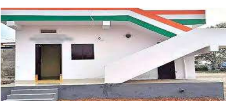
నిర్మించారు. గృహలక్ష్మి పథకం లబ్ధిదారులకు కూడా ఈ పథకాన్ని వర్తింపజేయనున్నారు. రాష్ట్రవ్యాప్తంగా తీరంగా పనులు ఇదిలా ఉండగా, తెలంగాణ రాష్ట్రవ్యాప్తంగా ఇందిరమ్మ ఇళ్ల పథకం అమలు చేసేందుకు సాగుతోంది. ప్రభుత్వం ఇప్పటివరకు 3 లక్షల ఇళ్లను మంజూరు చేయగా, వారిలో 2.50 లక్షల మంది లబ్ధిదారులు నిర్మాణ పనులను ప్రారంభించారు. వచ్చే నెలలో నాటికి లక్ష ఇళ్లను పూర్తి చేయాలని అధికారులు లక్ష్యంగా పెట్టుకున్నారు.

సొంత స్థలం ఉన్నవారికి తొలి ప్రాధాన్యం ప్రస్తుతం సొంత స్థలం ఉంది కూడా ఆర్థిక ఇబ్బందులు వల్ల ఇల్లు నిర్మించుకోలేని పేదలకు తొలి విదతలో ప్రాధాన్యం ఇవ్వనున్నారు. వీరికి ఇంటి నిర్మాణానికి ప్రభుత్వం రూ. 5 లక్షల ఆర్థిక సాయం అందిస్తున్న ప్రాంతాల్లోనే గ్రేటర్ పరిధిలో సుమారు 12 లక్షల ఇంటిని ఇచ్చే ఇళ్ల కోసం దరఖాస్తు చేసుకోగా, ప్రాథమిక పరిశీలనలో 18 వేల మందిని ఆర్డులుగా అధికారులు గుర్తించారు. అయితే, ఈ జాబితాను మరోసారి క్షుణ్ణంగా పరిశీలించి, వారం రోజుల్లో తుది జాబితాను సిద్ధం చేయాలని భావిస్తున్నారు. ఆదాయ పరిమితి, భూ యాజమాన్య పత్రాలు, కుటుంబ పరిస్థితులు వంటి అంశాలను పరిగణనలోకి తీసుకుని లబ్ధిదారులను ఎంపిక చేయనున్నారు.