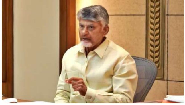
తొలివార్త, అమరావతి, ఫిబ్రవరి 25 : గత వైసీపీ పాలనలో రాష్ట్రం విధ్వంసమైందని ఆంధ్రప్రదేశ్ ముఖ్యమంత్రి నారా చంద్రబాబునాయుడు ఆవేదన వ్యక్తం చేశారు. పునర్నిర్మాణం కోసం గత ఎన్నికల్లో ప్రజల సహకారం కోరానని తెలిపారు. రాష్ట్రం కోసమే జనసేన, బీజేపీతో కలిసి ఎన్నియే కూటమిగా ఏర్పడి ప్రజల ఆశీస్సులు అందుకున్నామని అన్నారు. గత అసెంబ్లీ ఎన్నికల్లో 94 శాతం స్ట్రెక్ రేటుతో అఖండ విజయం కట్టబెట్టారని ఆనందం వ్యక్తం చేశారు. అరకు నుంచి ఉమ్మడి ప్రకాశం వరకు ఒక్క సీటు కూడా వైసీపీకి రాలేదని అన్నారు. 'మార్కాపురం జిల్లా కళ, వెలిగొండతో జలకళ, హాల్కల్లర్ రైతుల జీవితాల్లో కళకళ కార్యక్రమంలో ముఖ్యమంత్రి మాట్లాడారు. వేదిక వద్ద ఏర్పాటు చేసిన ర్యాంపుపై కలియతిరుగుతూ - మిగతా 2 లో