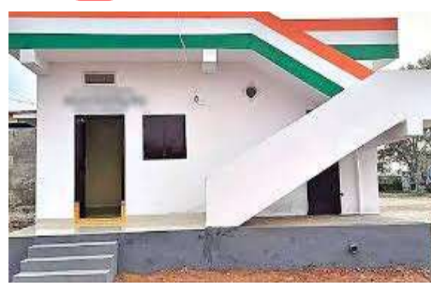
తొలివార్త, హైదరాబాద్, ఫిబ్రవరి 25 : హైదరాబాద్ నగరంలోని నిరుపేదలకు రేవంత్ రెడ్డి ప్రభుత్వం శుభవార్త అందించింది. రాష్ట్రవ్యాప్తంగా అమలువుతున్న ఇందిరమ్మ ఇళ్ల పథకాన్ని గ్రేటర్ హైదరాబాద్ మున్సిపల్ కార్పొరేషన్ (జీహెచ్ఎంసీ) పరిధిలోనూ ప్రారంభించేందుకు సన్నాహాలు చేస్తోంది. ఉగాది వందగలోపు అర్హులైన అర్జీదారులకు ఇళ్ల మంజూరు పత్రాలు - మిగతా 2 లో