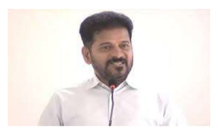
వార్త సంధ్య, హైదరాబాద్, ఫిబ్రవరి 21 : తాను డీసీసీ అధ్యక్ష బాధ్యతలు చేపట్టే నాటికి పార్టీ పరిస్థితి క్లిష్టంగా ఉందని తెలంగాణ ముఖ్యమంత్రి, కాంగ్రెస్ పార్టీ నాయకుడు రేవంత్ రెడ్డి అన్నారు. పార్టీలో కూడా కొందరి నుంచి వ్యతిరేకత ఎదురొచ్చినానని, నేతలందరినీ కలిసి తన ఆలోచన చెప్పి వారిని ఒప్పించానని గుర్తుచేసుకున్నారు. వికారాబాద్ జిల్లా అనంతగిరిలో నిర్వహించిన - మిగతా 2 లో