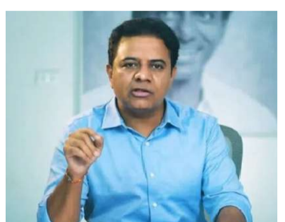
వార్త సంధ్య, హైదరాబాద్, ఫిబ్రవరి 21 : ఢిల్లీలో జరుగుతున్న ఇండియా ఏజ్ ఇంఫాక్ట్ సమ్మిట్ - 2026 వేదిక వద్ద యూత్ కాంగ్రెస్ నాయకులు చేసిన నిరసనపై బీఆర్ఎస్ వర్గం ప్రెసిడెంట్ కేటీఆర్ తీవ్రంగా స్పందించారు. ఇలాంటి అంతర్జాతీయ సదస్సులను రాజకీయ ప్రదర్శనలకు ఉపయోగించడం దేశ ప్రతిష్ఠను దెబ్బతీసే చర్య అని అభివ్యక్తించారు. అంతర్జాతీయ సదస్సులు దేశ ప్రతిష్ఠను, సామర్థ్యాన్ని ప్రపంచానికి చూపించే వేదికలని అన్నారు. ఇలాంటి వేదికల్లో హుందాగా వ్యవహరించాలని చెప్పారు. రాజకీయ