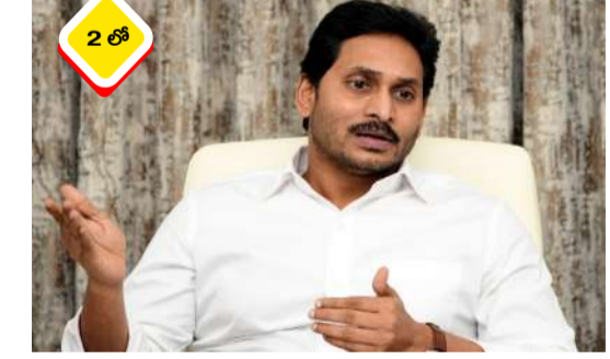
వార్త సంధ్య, అమరావతి, ఫిబ్రవరి 21 : ఢిల్లీలో నిన్న "ఇండియా ఏజ్ ఇంఫాక్ట్ సమ్మిట్ 2026"లో యూత్ కాంగ్రెస్ కార్యకర్తలు స్వచ్ఛందంగా నిరసన వ్యక్తం చేశారు. అంతర్జాతీయ - మిగతా 2 లో