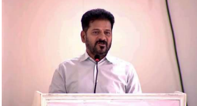
వార్త సంధ్య, హైదరాబాద్, ఫిబ్రవరి 21 : కాంగ్రెస్ పార్టీలో తొలి నుంచి భిన్నాభిప్రాయాలు వెలువరించే సంస్కృతి, స్వేచ్ఛ ఉందని ముఖ్యమంత్రి రేవంత్ రెడ్డి పేర్కొన్నారు. భిన్నాభిప్రాయాలు వెలువరించే మాత్రాన వారిని వేధించే సంస్కృతి పార్టీలో లేదన్నారు. మనలో మనం కొట్లాడుకుంటే పార్టీ కోసం కష్టపడే లక్షలాది కార్యకర్తలకు అన్యాయం చేసిన వాళ్లం అవుతామని పార్టీ నాయకులను ఉద్దేశించి అన్నారు. వికారాబాద్ జిల్లా అనంతగిరిలో డీసీసీ అధ్యక్షుల శిక్షణ తరగతుల కార్యక్రమాన్ని రేవంత్ రెడ్డి ప్రారంభించారు. అనంతరం ఆయన ప్రసంగించారు. కాంగ్రెస్ పార్టీని కనుమరుగు చేయాలనే కుట్ర జరుగుతోంది : అసెంబ్లీ ఎన్నికల్లో కాంగ్రెస్, బీఆర్ఎస్ మధ్య మెజార్టీ 2 శాతమే తేడా అని రేవంత్ రెడ్డి పేర్కొన్నారు. ఆర్మీ తర్వాత జరిగిన లోక్ సభ ఎన్నికల్లో కాంగ్రెస్ మెజార్టీ 4 శాతానికి పెరిగిందన్నారు. రేవంత్ రెడ్డి తర్వాత జరిగిన - మిగతా 2 లో