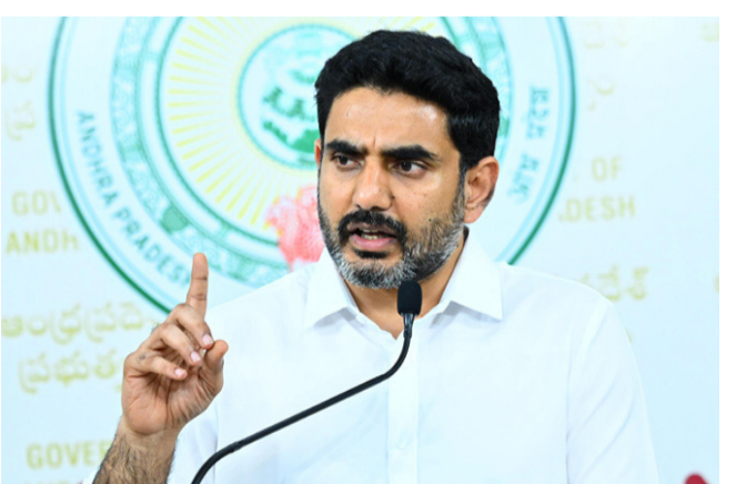
వార్త సంధ్య, ఆమరావతి, ఫిబ్రవరి 17: గత ప్రభుత్వం 2019-24 సమయంలో జీవో 117 తీసుకురావడంతో పేద పిల్లలు ప్రభుత్వ పాఠశాలలకు దూరమయ్యారని, ఈ క్రమంలో ఎన్నికల సమయంలో తాము ఇచ్చిన మాటను నిలబెట్టుకుంటూ ప్రజాప్రభుత్వం వచ్చాక ఆ జీవోను రద్దు చేశామని రాష్ట్ర విద్య, ఐటీ, ఎలక్ట్రానిక్స్ శాఖల మంత్రి నారా లోకేశ్ తెలిపారు. శాసనసభ ప్రశ్నోత్తరాల సమయంలో పలాస ఎమ్మెల్యే గౌతు శరీష్ ఆడిగిన ప్రశ్నకు మంత్రి లోకేశ్ సమాధానమిస్తూ, గత ప్రభుత్వం నాడు-నేడు కార్యక్రమం చేపట్టిన తర్వాత కూడా 233 పాఠశాలలు మూసివేసే పరిస్థితి ఏర్పడిందని అన్నారు. అంతేకాకుండా పాఠశాల విద్యార్థివృద్ధిలో వన్ క్లాస్ - వన్ టీచర్ విధానం చాలా తీలకమైందని, గతంలో 3 శాతం పాఠశాలల్లో మాత్రమే వన్ క్లాస్ - వన్ టీచర్ ఉంటే, ఇప్పుడు 33 శాతానికి పెంచామని అన్నారు. దీనివల్లా పిల్లలకు మెరుగైన విద్య - మిగతా 2 లో