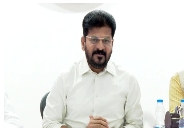
వార్త సంధ్య, హైదరాబాద్, ఫిబ్రవరి 17: హైదరాబాద్ లోని పురపాలక పరిపాలన, పట్టణాభివృద్ధిశాఖపై సీఎం రేవంత్ రెడ్డి సమీక్షించారు. జీహెచ్ఎంసీ విభజనలో తలెత్తిన సమస్యల పరిష్కారాలు సూచించారు. సీఎం, సీఎంవో సైక్లర్, హెచ్ఎంసీ కమిషనర్ తో కలిసి సీఎం సమీక్ష జరిపారు. పీవీపీ విధానంలో నిర్మాణాలు : హైదరాబాద్ లో స్టాల్స్ పోల్స్ ఏర్పాటుపై అధ్యయనం చేయాలని ఆయన సీఎం ఆదేశించారు. ట్రాఫిక్ అధికంగా ఉన్న బోట స్ట్రెవాక్ ట్రిబ్లీలు నిర్మించాలని సూచించారు. అవసరమైన బోట పీవీపీ విధానంలో స్ట్రెవాక్ నిర్మించాలని తెలిపారు. నెక్స్ట్ రోడ్ రైల్వే స్టేషన్ వద్ద పల్లెటెజ్ కార్ పార్కింగ్ ఏర్పాటు చేయాలని పేర్కొన్నారు. ఆయానికి గండి పడకుండా చర్యలు : ప్రకటన బోర్డుల ఏర్పాటుపై జాగ్రత్తలు తీసుకోవాలని ఆయన - మిగతా 2 లో