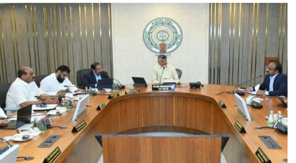
వార్త సంధ్య, అమరావతి, ఫిబ్రవరి 03 : తిరుమల కల్తీ లద్దా వ్యవహారంపై అసలు సూత్రధారుల్ని తేల్చేందుకు విచారణ కమిటీ వేయాలని మంత్రివర్గ సమావేశంలో నిర్ణయం తీసుకున్నారు. సింపి చంద్రబాబు అధ్యక్షతన సచివాలయంలో నిర్వహించిన మంత్రివర్గంలో సిట్ నివేదికపై చర్చ కొనసాగింది. అన్ని అంశాలను పక్కనపెట్టి మరీ తిరుమల లద్దా కల్తీ వ్యవహారంపై చర్చించారు. లద్దా కల్తీ జరిగిన విధానం, వివిధ విభాగాల తప్పిదాలను వివరిస్తూ నివేదిక ఉంది. ఇందులో ప్రభుత్వానికి సిట్ సమర్పించిన నివేదికలో పాత్రధారులపై మాత్రమే సిఫార్సు చేసేదని ఏపీ మంత్రి వర్గం అభిప్రాయపడింది. అసలు సూత్రధారుల్ని తేల్చేందుకు కమిటీ ఏర్పాటు చేయాలని మంత్రివర్గం నిర్ణయించింది. విచారణ అంశాలకు, ఛార్జీ షీట్ లో ఉన్న - మిగతా 2 లో