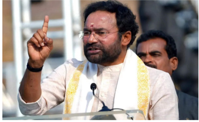
వార్త సంధ్య, హైదరాబాద్, ఫిబ్రవరి 03 : హైదరాబాద్ రైల్వే హబ్ కాబోతుందని కేంద్ర మంత్రి కిషన్ రెడ్డి అన్నారు. హైదరాబాద్ లో నిర్వహించిన మీడియా సమావేశంలో ఆయన మాట్లాడుతూ, 2026-27 బడ్జెట్ ఎన్నికల కోసం కాకుండా వికసన్ భారత్-2047 కోసం తీసుకువచ్చిన బడ్జెట్ అన్నారు. ఉచితాలు ప్రవేశపెట్టడం కోసమే బడ్జెట్ అన్నట్లుగా రాజకీయ పార్టీలు ప్రజల్లో తప్పుడు ప్రచారం చేస్తున్నాయని ఆగ్రహం వ్యక్తం చేశారు. ప్రజలు ఆశిస్తున్న సుస్థిర ప్రగతికి దోహదపడేలా బడ్జెట్ ఉందని అన్నారు. వీటి జే రామ్ జే రామ్ ద్వారా ఉపాధి హామీ పథకాన్ని - మిగతా 2 లో