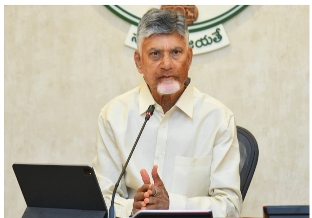
వార్త సంధ్య, అమరావతి, మార్చి 17: ఇరాన్ యుద్ధం నేపథ్యంలో, రాష్ట్రంలో ఎల్వీజీ గ్యాస్ నిల్వలు, సరఫరాపై ముఖ్యమంత్రి చంద్రబాబు ఉన్నత స్థాయి సమీక్ష నిర్వహించారు. గ్యాస్ కొరతపై ఊహాగానాలు వస్తుండడం పట్ల ఆయన అధికారులతో చర్చించారు. ప్రజలు ఎవరూ ఆందోళన చెందాల్సిన అవసరం లేదని చంద్రబాబు స్పష్టం చేశారు. ప్రస్తుతం రాష్ట్రంలో 14 వేల టన్నుల ఎల్వీజీ గ్యాస్ నిల్వలు ఉన్నాయని, మరో 15 రోజులకు సరిపడా గ్యాస్ అందుబాటులో ఉందని సీఎం వెల్లడించారు. అమరావతిలో జరిగిన ఈ సమీక్షా సమావేశంలో పెట్రోలియం కంపెనీల ప్రతినిధులు, గెయిల్, ఓఎస్సీసీ ఉన్నతాధికారులు పాల్గొన్నారు. ఆసుపత్రులు, హాస్పిటల్లు, ఆలయాలకు గ్యాస్ కొరత రాకుండా నిరంతరాయంగా సరఫరా చేయాలని సీఎం అధికారులను ఆదేశించారు. కేవల, ఓటీపీల ద్వారా సిలిండర్ల దుర్వినియోగాన్ని అరికట్టేందుకు కఠిన చర్యలు తీసుకోవాలని స్పష్టం చేశారు. పశ్చిమానాయాలో ఉద్రిక్తతలు, యుద్ధ పరిస్థితుల వల్ల అంతర్జాతీయంగా గ్యాస్ సరఫరాపై ప్రభావం పడుతున్నప్పటికీ, రాష్ట్రంలో ఎలాంటి ఇబ్బందులు తలెత్తకుండా ప్రభుత్వం అన్ని జాగ్రత్తలు తీసుకుంటోందని చంద్రబాబు భరోసా ఇచ్చారు. ఇండక్షన్ స్టవ్ల ఉత్పత్తి, పంపిణీని పెంచే వాటి లభ్యతను ప్రజలకు అందుబాటులోకి తీసుకురావాలని సూచించారు. అదే సమయంలో, సీటీ గ్యాస్ - మిగతా 2 లో