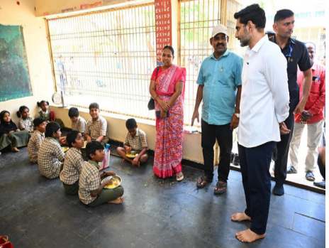
వార్త సంధ్య, అమరావతి, మార్చి 17: ప్రభుత్వ పాఠశాలల్లో విద్యార్థులకు అందించే మధ్యాహ్న భోజనం విషయంలో ఏమాత్రం నిర్లక్ష్యం వహించినా, తప్పు పునరావృతం అయినా కఠిన చర్యలు తప్పవని విద్యాశాఖ మంత్రి నారా లోకేశ్ అధికారులను తీవ్రంగా హెచ్చరించారు. చిన్న సమస్య ఉన్నా వెంటనే గుర్తించి పరిష్కరించాలని, ఈ పవిత్ర భార్యతను - మిగతా 2 లో