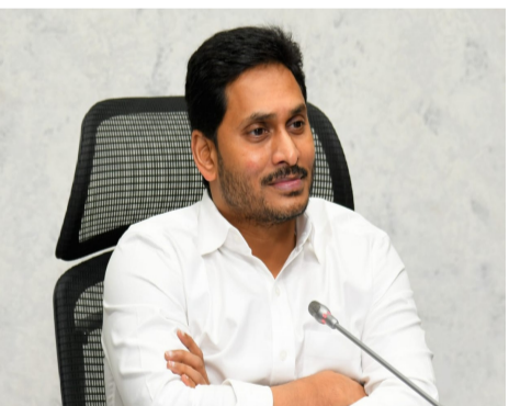
వార్త సంధ్య, అమరావతి, మార్చి 17: అని... విలువలు, విశ్వసనీయతే పార్టీకి పునాదులని ఆయన అన్నారు. తమ ఐదేళ్ల పాలనకు, ప్రస్తుత చంద్రబాబు పాలనకు మధ్య ఉన్న తేడాను ప్రజలు ఇప్పటికే గమనిస్తున్నారని జగన్ పేర్కొన్నారు. తాము అధికారంలో ఉన్నప్పుడు కోవిడ్ వంటి కష్టాలు ఎదురైనా, ఆర్థిక ఒత్తిళ్ల మధ్య - మిగతా 2 లో