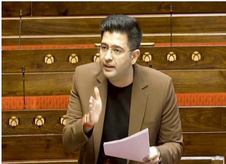
వార్త సంధ్య, ఢిల్లీ, మార్చి 17: పార్లమెంట్ వేదికగా ఆమ్ ఆర్టీ పార్టీ ఎంపీ రాఘవ్ చద్దా 'మినిమం బ్యాలెన్స్' పెనాల్టీల అంశంపై తీవ్రస్థాయిలో ధ్వజమెత్తారు. బ్యాంకింగ్ వ్యవస్థలో జరుగుతున్న ఈ నిశ్చల దోపిడిపై ఆయన ఆందోళన గతాంశాలు విస్తరంగా వివరించారు. బ్యాంకుల ఖాతాల్లో కనీస నిల్వ (మినిమం బ్యాలెన్స్) లేదనే నెపంతో గత మూడేళ్లలో బ్యాంకులు ఏకంగా రూ.19 వేల కోట్లు పసూలు చేశాయని రాఘవ్ చద్దా తీవ్ర ఆగ్రహం వ్యక్తం చేశారు. ఈ ఖాతా మొత్తం అవర కోటీశ్వరులు - మిగతా 2 లో