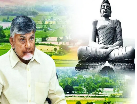
అద్భుత నగరంగా తీర్చిదిద్దడామని, అక్కడ నివసించే వారు మిగతా వారికంటే 20 ఏళ్లు ఎక్కువ జీవించాలా అత్యుత్తమ వాతావరణం కల్పిస్తామని ధీమా వ్యక్తం చేశారు. మిగతా ప్రాంతాలతో పోల్చితే ఏపీ రాజధానిలో జీవన ప్రమాణాలు అత్యున్నత స్థాయిలో ఉండేలా చూస్తామని చెప్పారు. ఈ సందర్భంగా హైదరాబాద్ నగర అభివృద్ధికి తాను చేసిన కృషిని చంద్రబాబు గుర్తుచేసుకున్నారు. - మిగతా 2 లో