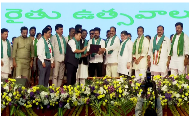
వార్త సంధ్య, హైదరాబాద్, మార్చి 22: రాష్ట్రంలోని రైతులకు పెట్టుబడి సాయం అందించేందుకు తెలంగాణ ప్రభుత్వం రైతు భరోసా పథకాన్ని ప్రారంభించింది. దీనికి సంబంధించిన నిధులను ముఖ్యమంత్రి రేవంత్ రెడ్డి విడుదల చేశారు. ఈ పథకం కింద 1.50 కోట్ల ఎకరాలకు సాయం అందించనున్నారు. దీనికోసం రూ.9 వేల కోట్లను ప్రభుత్వం సమకూర్చుకుంది. సిద్దిపేట జిల్లా నర్సేట్లో ఆదివారం జరిగిన సభలో ఉప ముఖ్యమంత్రి భద్రీ విక్రమార్య, వ్యవసాయ శాఖ మంత్రి తుమ్మల - మిగతా 2 లో