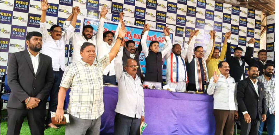
చాలాకునేందుకు బార్ అసోసియేషన్ ఎన్నికల్లో బహుజనులు ఎన్నుకుందామని పిలుపునిచ్చారు భోజన జీవితాలపై తీర్పులు చెప్పే న్యాయమూర్తులు ఆ బహుజన మధ్య నుండి రావాలని ఆయన