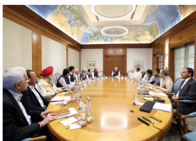
తెలిపాయి. ప్రపంచ ఇంధన రవాణాలో కీలకమైన చార్యూజ్ జలసంధిని ఇరాన్ తన ఆధీనంలో ఉంచుకుంది. యుద్ధం మొదలైనప్పటి నుంచి ఇరాన్ చాలా తక్కువ నౌకలను మాత్రమే దీని గుండా అనుమతిస్తోంది. ఈ దిగ్బంధం వల్ల భారత్ సహా అనేక దేశాలకు ఇంధన సరఫరాలో తీవ్ర అంతరాయం ఏర్పడింది. ఈ నేపథ్యంలో ప్రధాని మోదీ ఇప్పటికే సౌదీ అరేబియా, యూఏఈ, ఖతార్, బ్రహ్మాయిన్, కువైట్, జోర్డాన్, ఫ్రాన్స్, మలేషియా, ఇజ్రాయెల్, ఇరాన్ నాయకులతో ఫోన్ ద్వారా చర్చలు జరిపారు. - మిగతా 2 లో