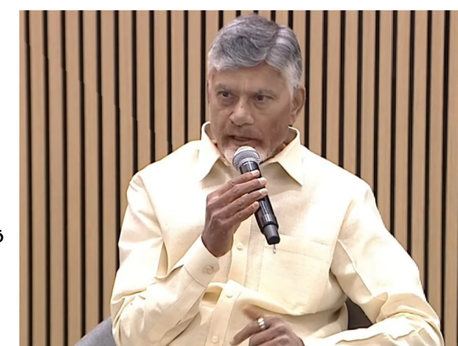
హైదరాబాద్ ను ప్రపంచవటంలో నిలిపిన తన ప్రస్థానాన్ని, రాజకీయంగా ఎదురైన సవాళ్లను, భవిష్యత్ ఆంధ్రప్రదేశ్ కోసం తనకున్న దార్శనికతను ఆయన పారిశ్రామికవేత్తలతో చంచుకున్నారు. అభివృద్ధి, సంక్షేమం, సువరిపాలన అనేవి మూడు కీలక స్తంభాలని, వీటిని సమన్వయం చేసుకుంటూ ముందుకు సాగడమే తన లక్ష్యమని స్పష్టం చేశారు. బంజరు భూమి నుంచి భాగ్యనగరంగా.. 1995లో తాను ఉమ్మడి ఆంధ్రప్రదేశ్ ముఖ్యమంత్రిగా బాధ్యతలు స్వీకరించేనాటికి హైదరాబాద్, సికింద్రాబాద్ అనే జంబు నగరాలు మాత్రమే ఉన్నాయని - మిగతా 2 లో