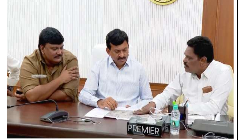
వరంగల్ విమానాశ్రయానికి శంకుస్థాపన చేస్తామని తెలంగాణ రాష్ట్ర మంత్రి పొంగలతీ తీనివాన్ రెడ్డి అన్నారు. సచివాలయంలో ఎయిర్ పోర్ట్ అథారిటీ సరదర్ రీజియల్ ఎగ్జిక్యూటివ్ డైరెక్టర్ రాజీవ్ షర్మ, ఏఎయ్ షర్మ భరత్ రెడ్డి, ఇతర అధికారులతో విమానాశ్రయాల ఏర్పాటుపై మంత్రి సమీక్ష నిర్వహించారు. వరంగల్, ఆదిలాబాద్, కొత్తగూడెంలో విమానాశ్రయాల నిర్మాణంపై సమీక్ష జరిపారు. ఈ సందర్భంగా ఆయన మాట్లాడుతూ, ప్రాజెక్టుల నిర్మాణానికి అవసరమైన భూసేద్యం, సాంకేతిక అనుమతులు, మౌలిక వసతుల ఏర్పాటుకు చర్యలను వేగవంతం చేయాలని సూచించారు. కేంద్ర ప్రభుత్వంతో సమన్వయం చేసుకుంటూ పనులను త్వరితగతిన ముందుకు తీసుకువెళ్లాలని అధికారులకు సూచించారు. వరంగల్ విమానాశ్రయానికి సంబంధించి ఇప్పటికే సుమారు 950 ఎకరాల భూమిని సేకరించి కేంద్రానికి అప్పగించిన విషయాన్ని గుర్తు చేశారు. త్వరలో శంకుస్థాపన చేయనున్నట్లు చెప్పారు. డిప్యూటీ సీఎం ఏఎయ్ షర్మ, తెలంగాణ ప్రభుత్వం సంయుక్త అధ్యక్షులతో ఆదిలాబాద్ విమానాశ్రయ అభివృద్ధికి మార్గం సుగమం చేయాలని అధికారులకు సూచించారు. భద్రాద్రి కొత్తగూడెం జిల్లాలో గతంలో ప్రతిపాదించిన స్టండ్ విమానాశ్రయ నిర్మాణానికి అనుకూలంగా లేదని కేంద్ర పౌర విమానయాన శాఖ తెలిపిన నేపథ్యంలో, దీనిపై మరింత లోతైన అధ్యయనం చేసే సాధ్యాసాధ్యాలపై నివేదిక రూపొందించాలని అధికారులను ఆదేశించారు.

మొదటివేళ తరువాయి - వరంగల్ విమానాశ్రయానికి త్వరలో శంకుస్థాపన చేస్తామని తెలంగాణ రాష్ట్ర మంత్రి పొంగలతీ తీనివాన్ రెడ్డి అన్నారు. సచివాలయంలో ఎయిర్ పోర్ట్ అథారిటీ సరదర్ రీజియల్ ఎగ్జిక్యూటివ్ డైరెక్టర్ రాజీవ్ షర్మ, ఏఎయ్ షర్మ భరత్ రెడ్డి, ఇతర అధికారులతో విమానాశ్రయాల ఏర్పాటుపై మంత్రి సమీక్ష నిర్వహించారు. వరంగల్, ఆదిలాబాద్, కొత్తగూడెంలో విమానాశ్రయాల నిర్మాణంపై సమీక్ష జరిపారు. ఈ సందర్భంగా ఆయన మాట్లాడుతూ, ప్రాజెక్టుల నిర్మాణానికి అవసరమైన భూసేద్యం, సాంకేతిక అనుమతులు, మౌలిక వసతుల ఏర్పాటుకు చర్యలను వేగవంతం చేయాలని సూచించారు. కేంద్ర ప్రభుత్వంతో సమన్వయం చేసుకుంటూ పనులను త్వరితగతిన ముందుకు తీసుకువెళ్లాలని అధికారులకు సూచించారు. వరంగల్ విమానాశ్రయానికి సంబంధించి ఇప్పటికే సుమారు 950 ఎకరాల భూమిని సేకరించి కేంద్రానికి అప్పగించిన విషయాన్ని గుర్తు చేశారు. త్వరలో శంకుస్థాపన చేయనున్నట్లు చెప్పారు. డిప్యూటీ సీఎం ఏఎయ్ షర్మ, తెలంగాణ ప్రభుత్వం సంయుక్త అధ్యక్షులతో ఆదిలాబాద్ విమానాశ్రయ అభివృద్ధికి మార్గం సుగమం చేయాలని అధికారులకు సూచించారు. భద్రాద్రి కొత్తగూడెం జిల్లాలో గతంలో ప్రతిపాదించిన స్టండ్ విమానాశ్రయ నిర్మాణానికి అనుకూలంగా లేదని కేంద్ర పౌర విమానయాన శాఖ తెలిపిన నేపథ్యంలో, దీనిపై మరింత లోతైన అధ్యయనం చేసే సాధ్యాసాధ్యాలపై నివేదిక రూపొందించాలని అధికారులను ఆదేశించారు.