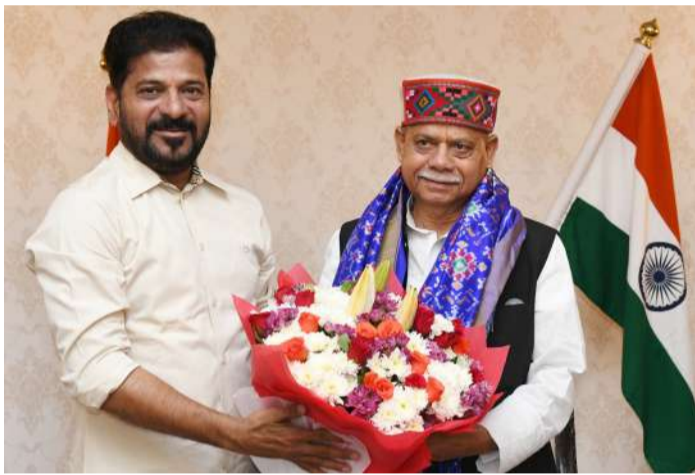
వార్త సంధ్య హైదరాబాద్, ఏప్రిల్ 19: పెండింగ్లో ఉన్న ఇద్దరు గవర్నర్ కోటా ఎమ్మెల్యేల పేర్లు ఆమోదించాలని గవర్నర్ శివప్రతాప్ శుక్లాను సీఎం రేవంత్ రెడ్డి కోరారు. ప్రొఫెసర్.కోదండరామ్, అజారుద్దీన్ పేర్లు ఆమోదించాలని విజ్ఞప్తి చేశారు. ఏ సభలో సభ్యుడు కానప్పటికీ మంత్రిగా అజారుద్దీన్ కొనసాగుతున్నారు. ఆయన మంత్రి పదవి చేపట్టి ఈ నెలఖారుకు - మిగతా 2 లో