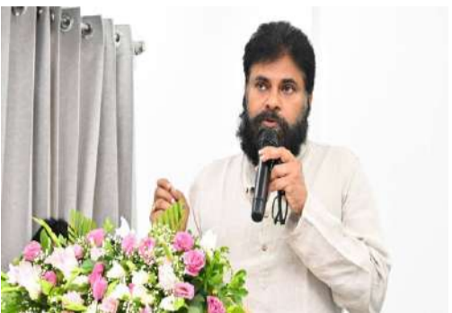
అన్యాయ, మీ ప్రేమ, ఆశీస్సులు, నిరంతర సంరక్షణకు నా హృదయపూర్వక కృతజ్ఞతలు. మీ మేలులు చెప్పడం ద్వారా రక్షణను, బలాన్ని ఇచ్చారు. మీ ఆశీస్సులతో త్వరలోనే కోలుకుని తిరిగి ప్రజాసేవకు వస్తాను" అని బయటిచ్చారు. మరో సోదరుడు, జనసేన ఎమ్మెల్యే నాగబాబు కూడా పవన్ త్వరగా కోలుకోవాలని ఆకాంక్షించారు. "మన ప్రయతన నాయకుడు పవన్ కల్యాణ్ కు శస్త్రచికిత్స విజయవంతమైంది. ఆయన కొన్ని రోజులు విశ్రాంతి తీసుకుని, నూతన శక్తితో తిరిగి వస్తారు. ఆయన సంపూర్ణ

మొదటివేళ తరువాయి - ఆంధ్రప్రదేశ్ ఉప ముఖ్యమంత్రి, జనసేన అధినేత పవన్ కల్యాణ్ తాను క్రమంగా కోలుకుంటున్నారని వెల్లడించారు. ఇటీవల హైదరాబాద్ లోని అపోలో ఆసుపత్రిలో తనివారం నాడు శస్త్రచికిత్స విజయవంతంగా జరిగింది. పవన్ కల్యాణ్ కొంతకాలంగా సైన్ సైటిన్ సమస్యతో బాధపడుతున్నట్లు తెలుస్తోంది. సర్జరీ విజయవంతమైన నేపథ్యంలో తన ఆరోగ్యం త్వరగా కుదుటపడాలని ఆకాంక్షించిన కేంద్ర, రాష్ట్ర మంత్రులు, వివిధ రాజకీయ పార్టీల నాయకులు, సినీ ప్రముఖులతో పాటు యావత్ ప్రజానీకానికి ఆయన హృదయపూర్వక ధన్యవాదాలు తెలియజేశారు. పలువురు నేతల ద్వీష్టకు స్పందిస్తూ, తన ఆరోగ్యం నిలకడగా ఉందని, అందోళన చెందాల్సిన అవసరం లేదని పేర్కొన్నారు. పవన్ కల్యాణ్ ఆరోగ్య పరిస్థితిపై ఆయన సోదరుడు, మోసాఫర్ విరంజీవి ఎక్స్ వేదికగా స్పందించారు. "కల్యాణ్ బాబుకు వైద్య ప్రక్రియ విజయవంతంగా పూర్తయింది. ప్రస్తుతం ఆయన క్షేమంగా, నిలకడగా కోలుకుంటున్నారు. వైద్యుల సూచన మేరకు, సాధారణ కార్యకలాపాల్లోకి తిరిగి రావడానికి సుమారు వారం రోజులు పట్టవచ్చు. అందోళన చెందాల్సిన అవసరం లేదు. మీ ఆందోళన ప్రేమ, ప్రార్థనలకు ధన్యవాదాలు" అని చిరంజీవి పేర్కొన్నారు. దీనికి పవన్ కల్యాణ్ స్పందిస్తూ, "ధన్యవాదాలు