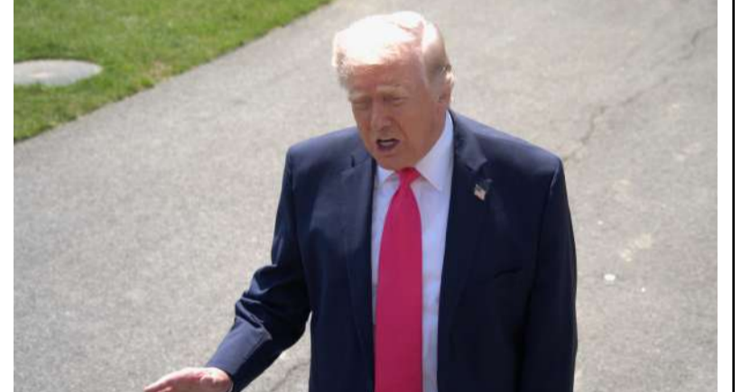
అన్నారు. పశ్చిమాసియాలో ఉద్రిక్తతలు తారాస్థాయికి చేరిన నేపథ్యంలో సోమవారం జరగనున్న చర్చలపై సర్వత్రా ఆసక్తి నెలకొంది.

మొదటివేళ తరువాయి - అమెరికా అధ్యక్షుడు డొనాల్డ్ ట్రంప్, ఇరాన్ కు మరోసారి తీవ్రమైన హెచ్చరికలు జారీ చేశారు. ఒప్పందానికి అంగీకరించకపోతే ఇరాన్ లోని ప్రతి విద్యుత్ కేంద్రాన్ని, ప్రతి వంతెనను నాశనం చేస్తామని స్పష్టం చేశారు. అయితే, ఇదే సమయంలో ఇరు దేశాల మధ్య చర్చల కోసం రెచ్చ (ఏప్రిల్ 20న) అమెరికా ప్రతినిధి బృందం పాకిస్థాన్ రాజధాని ఇస్లామాబాద్ కు వెళ్లనుందని వెల్లడించారు. ఈ మేరకు ట్రాంప్ సోషల్ వేదికగా ట్రంప్ ఒక పోస్ట్ చేశారు. "మేం చాలా న్యాయమైన ఒప్పందాన్ని ప్రతిపాదిస్తున్నాం. దానికి వారు అంగీకరిస్తారని ఆశిస్తున్నాం. ఒకవేళ ఒప్పుకోకపోతే, ఇరాన్ లోని ప్రతి విద్యుత్ కేంద్రాన్ని, ప్రతి వంతెనను అమెరికా కూల్చేస్తామి. ఇకపై మంచిగా వ్యవహరించేది లేదు" అని ఆయన ఘాటుగా వ్యాఖ్యానించారు. ఇరాన్ హంతక యంత్రాంగాన్ని అంతం చేసే సమయం వచ్చిందని, గత 47 ఏళ్లుగా ఇతర అధ్యక్షులు చేయలేని తాను తాను చేస్తానని అన్నారు. గతంలో ఏప్రిల్ 11న ఇస్లామాబాద్ లో పాకిస్థాన్ మధ్యవర్తిత్వంతో జరిగిన చర్చలు విఫలమయ్యాయి. ఇరాన్ అణు కార్యక్రమాన్ని నిలిపివేయాలని అమెరికా డిమాండ్ చేయగా, తమపై విధించిన ఆంక్షలు ఎత్తివేసి, స్పందించజేసిన అస్థులను విడుదల చేయాలని ఇరాన్ కోరింది. ఆ చర్చలు విఫలమవుతుంటే హర్యాణ్ జలసంధిలో అమెరికా నావికాదళ దిగ్గొందనం విధించగా, దానికి ప్రతిగా ఇరాన్ ఆ జలసంధిని మూసివేసింది. కాగా, హర్యాణ్ జలసంధిలో ఇరాన్ కాల్యుల విరమణ ఒప్పందాన్ని ఉల్లంఘించిందని ట్రంప్ ఆదివారం ఆరోపించారు. ప్రాన్స్, బ్రెజిల్ కు చెందిన నౌకలపై ఇరాన్ కాల్యులు బరిపెందని తెలిపారు. జలసంధిని మూసివేయడం వల్ల ఇరాన్లో రోజుకు 500 మిలియన్ డాలర్ల నష్టం వాటిల్లుతుంది దని