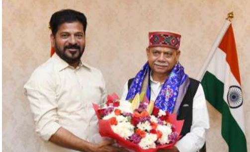
పల్ల కలిగి అసర్వాలపై నిరంతరం అవగాహన కల్పించాలని, విద్యార్థులతో సామాజిక ప్రమాణాలు చేయించాలని సీఎం రేవంత్ రెడ్డికి గవర్నర్ సూచించారు. మోడరన్ విద్యార్థులను నివారణపై రాష్ట్రస్థాయిలో చైతన్యం తీసుకురావడానికి జూన్ 12న హైదరాబాద్ లోని ఎక్స్ స్టేషన్ లో గవర్నర్ అధ్యక్షులలో భాగీ బహురంగ కార్యక్రమాన్ని ప్రభుత్వం నిర్వహించింది. ఈ సభ ద్వారా రాష్ట్రంలోని విద్యార్థులకు, యువశక్తి డ్రగ్స్ లేని సమాజం ప్రామాణ్యతను వివరించనున్నారు. ఈ కార్యక్రమం నిర్వహణ బాధ్యతలపై రేవంత్ రెడ్డితో గవర్నర్ చర్చించారు. కేవలం డ్రగ్స్ అంతమే కాకుండా, రాష్ట్రంలోని విద్యా రంగంలో మౌలిక వసతులు, యూనివర్సిటీలలో భాగీగా ఉన్న విద్యావేతన పోస్టులు, ఉన్నత విద్యా ప్రమాణాలు మెరుగుదలపై భేటీలో చర్చకు వచ్చినట్లుగా తెలిసింది. విద్యార్థుల భవిష్యత్తుకు భరోసా ఇచ్చేలా విద్యా సంస్థల పనితీరు

మొదటివేళ తరువాయి - ఆరు నెలలు పూర్తి కానుంది. 6 మాసాల్లోపు ఏదో ఒక సభలో సభ్యుడిగా ఉండాల్సిన అవసరం ఉంది. గవర్నర్ ఆమోదించకపోతే ఈ నెల 30 తర్వాత అజారుద్దీన్ పదవి కోల్పోయే అవకాశం ఉంది. ఈ నేపథ్యంలోనే గవర్నర్ ను సీఎం కలిసినట్లుగా తెలిసింది. దీంతో పాటు విద్యారంగానికి సంబంధించి పలు అంశాలు వారి మధ్య చర్చకు వచ్చినట్లుగా ముఖ్యమంత్రి కార్యాలయం ఎక్స్ లో పేర్కొంది. తెలంగాణ రాష్ట్ర భవిష్యత్తును పట్టి పిడిస్తున్న డ్రగ్స్ మహమ్మాయిని అంతం చేయడమే లక్ష్యంగా లోకేష్ వద్దలో కీలక నిర్ణయాలు తీసుకున్నారు. గవర్నర్ శివప్రతాప్ శుక్లాతో ముఖ్యమంత్రి రేవంత్ రెడ్డి ప్రత్యేకంగా సమావేశమయ్యారు. ఈ భేటీలో జీడి, పరిశ్రమల శాఖ మంత్రి దుర్గిణ్ శ్రీధర్ బాబు, రాజ్యాభివృద్ధి వేగం సరేందర్ రెడ్డి కూడా పాల్గొన్నారు. తెలంగాణ యువశక్తి, విద్యా వ్యవస్థను మోడరన్ చేయాలని ఆయన ప్రకటించారు. ప్రభుత్వం, లోకేష్ భవన్ కలిసి కార్యవరణ సిద్ధం చేస్తున్నాం. దాదాపు గంటకు పైగా సేగం ఈ సమావేశంలో గవర్నర్ పలు నిరాశాత్మక సూచనలు విచ్చూసినట్లు ముఖ్యమంత్రి కార్యాలయం ప్రకటించింది. విద్యార్థులకు అందుబాటులో ఉండే సమయంలోనే మేము మోడరన్ చేయాలని మనకు ఉంటుంది వాదించి ప్రోత్సహించాల" అని విద్యార్థుల నుంచి అధికారికంగా ప్రమాణ పత్రం తీసుకోవాలని సూచించారు. సీఎంకె పలు కీలక సూచనలు చేసిన గవర్నర్ : విద్యార్థులందరికీ కేవలం చదువు మాత్రమే కాకుండా, డ్రగ్స్