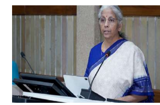
కూడా 'మిథోస్' ముప్పుపై వాల్స్ట్రీట్ బ్యాంకులతో చర్చలు జరుపుకోవాలి. మరోవైపు, ఈ ఏఐ వల్ల భారత ఆర్థిక రంగానికి ఎంత మేరకు ప్రమాదం ఉందనే అంశంపై ఆర్థిక మంత్రిత్వ శాఖ, రిజర్వ్ బ్యాంక్ ఆఫ్ ఇండియా అధ్యయనం చేస్తున్నాయి.

పొందినట్లైన అంతర్జాతీయ హెచ్చరించబడింది. ఈ నేపథ్యంలో కొందరు అసెంబ్లీకాంక్షా ఈ ఏఐ యాక్సెస్ చేశారన్న వార్తలు అందోళన రేపిస్తున్నాయి. ఈ ముప్పు అసాధారణమైనదని, బ్యాంకులు, ఆర్థిక సంస్థల మధ్య అత్యంత జాగ్రత్తకాక, సమస్యలను అవసరమని అర్థిక మంత్రిత్వ శాఖ 'ఎక్స్' వేదికగా పేర్కొంది. బ్యాంకులు తమ బీజే వ్యవస్థలను పటిష్ఠం చేసుకోవాలని, వినియోగదారుల డేటాను కాపాడేందుకు ముందస్తు చర్యలు తీసుకోవాలని నిర్మలా సీతారామన్ అవేశించారు. ముప్పును నిజ సమయంలో గుర్తించి, దాని వివరాలను బ్యాంకులు, ఇండియన్ కంప్యూటర్ ఎమ్మెస్సీ రెస్పాన్స్ టీమ్ వంటి సంస్థల మధ్య పంచుకోవడానికి ఒక బలమైన యంత్రాంగాన్ని ఏర్పాటు చేయాలని సూచించారు. తక్షణమే స్పందించేందుకు ఏఐలు ఒక సమన్వయ సంస్థగా యంత్రాంగాన్ని అభివృద్ధి చేయాలని ఇండియన్ బ్యాంక్స్ అసోసియేషన్ మంత్రి సూచించారు. కేవలం భారత్ లోనే కాకుండా, అమెరికా ప్రభుత్వం