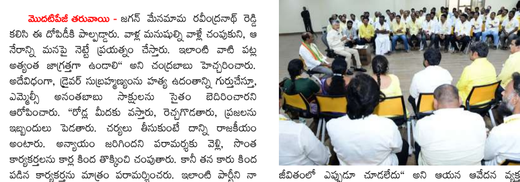
జీవితంలో ఎప్పుడూ చూడలేదు" అని ఆయన ఆవేదన వ్యక్తం