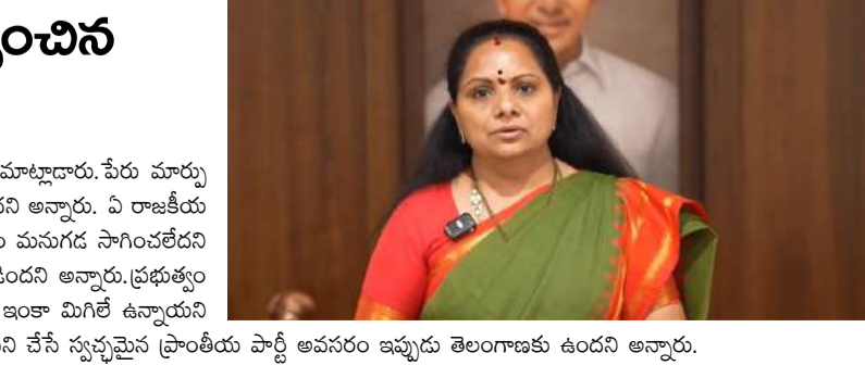
అన్నారు. వీటిని సాధించడమే మానా ప్రారంభించబోయే పార్టీ ప్రధాన ఉద్దేశమని అన్నారు. ప్రజల కోసం పని చేసే స్వచ్ఛమైన ప్రాంతీయ పార్టీ అవసరం ఇప్పుడు తెలంగాణకు ఉందని అన్నారు.

మొదటివేళ తరువాయి - నేడు కొత్త రాజకీయ పార్టీని ప్రకటించనున్న నేపథ్యంలో ఆమె మీడియాతో మాట్లాడారు. పేరు మార్పు మొదలు ప్రతి విషయంలో బీఆర్ఎస్ మాదిరిగానే దీనితో ఆ పార్టీకి ప్రజలతో ఉన్న పేగుబంధం తెగిపోయిందని అన్నారు. ఏ రాజకీయ పార్టీ అయినా తన ప్రాథమిక ఉద్దేశం, మూల సిద్ధాంతం నుంచి పక్కకు తప్పుకుంటే ఆ పార్టీ ఎక్కువ కాలం మనుగడ సాగించలేదని అన్నారు. బీఆర్ఎస్ తన ప్రాథమిక ఉద్దేశం నుంచి పక్కకు తప్పుకోవడం వల్ల ఆ పార్టీకి ఈ పరిస్థితి ఏర్పడిందని అన్నారు. ప్రభుత్వం మానా తెలంగాణలో ఎన్నో సమస్యలు ఉన్నాయని ఆందోళన వ్యక్తం చేశారు. తెలంగాణ ప్రజల అంక్షలు ఇంకా మిగిలే ఉన్నాయని అన్నారు. వీటిని సాధించడమే మానా ప్రారంభించబోయే పార్టీ ప్రధాన ఉద్దేశమని అన్నారు. ప్రజల కోసం పని చేసే స్వచ్ఛమైన ప్రాంతీయ పార్టీ అవసరం ఇప్పుడు తెలంగాణకు ఉందని అన్నారు.