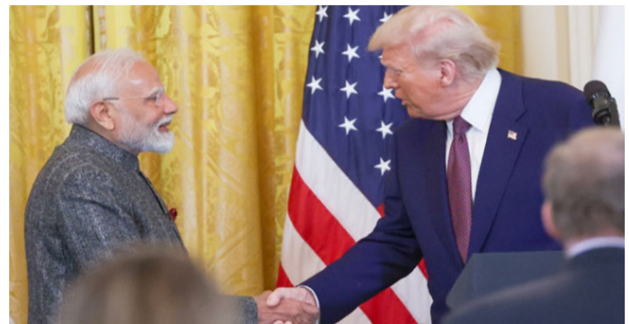
వార్త సంధ్య, డి.వై.ఎం. 20 : ప్రపంచ రాజకీయాల్లో తీవ్ర ఆసక్తి రేకెత్తించే అతికొద్ది సమావేశాల్లో భారత ప్రధాని నరేంద్ర మోదీ, అమెరికా అధ్యక్షుడు డొనాల్డ్ ట్రంప్ భేటీ ఒకటి. గతేడాది వారిద్దరి మధ్య తలెత్తిన విభేదాల తర్వాత ఇప్పుడు మళ్ళీ వారిద్దరూ ముఖాముఖీ కలుసుకునే అవకాశం కనిపిస్తోంది. ఫ్రాన్స్ లో వచ్చే నెలలో జరగనున్న జీ7 శిఖరాగ్ర సదస్సు - మిగతా 2 లో