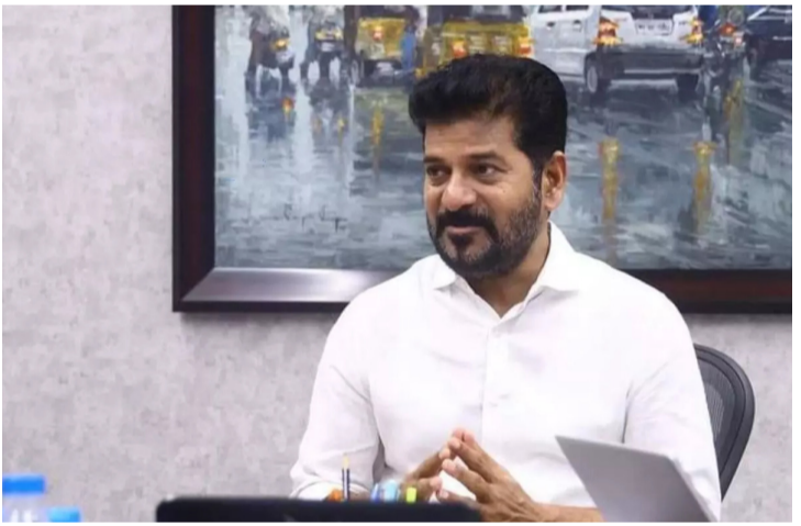
వార్త సంధ్య, హైదరాబాద్, మే 20 : తెలంగాణలో రోజురోజుకూ ముదురుతున్న ఎండల తీవ్రత, పడగాల్తులపై ముఖ్య మంత్రి రేవంత్ రెడ్డి తీవ్ర ప్రభుత్వ యంత్రాంగాన్ని, ప్రజలను అప్రమత్తం చేశారు. ముఖ్యంగా ఉత్తర తెలంగాణ జిల్లాల్లో గరిష్ట ఉష్ణోగ్రతలు నమోదవుతున్నాయన్న వాతా వరణ శాఖ హెచ్చరికల నేపథ్యంలో సీఎం స్పందించారు. జిల్లాల్లో మారుతున్న పరిస్థితులను - మిగతా 2 లో