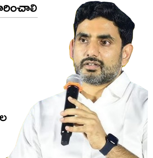
వార్త సంధ్య, అమరావతి, మే 20 : "దేశానికే ఆదర్శంగా ఆంధ్ర మోడల్ ఎడ్యుకేషన్ ఉండాలన్నది నా ధ్యేయం. అందుకు అనుగుణంగా విద్యావ్యవస్థను తీర్చిదిద్దేందుకు కృతనిశ్చయంతో ఉన్నాను. అంతర్జాతీయస్థాయి అత్యుత్తమ బోధనా పద్ధతులపై ఆధ్యయనానికి ఉపాధ్యాయులను విదేశాలకు పంపుతున్నాం. ఆత్మగౌరవం తెలుసుకున్న మంచి బోధనా పద్ధతులను రాష్ట్రంలో అమలు చేస్తాం" అని విద్య, ఐటీ, ఎలక్ట్రానిక్స్ శాఖల మంత్రి వారాహ్ లోకేశ్ పేర్కొన్నారు. అమరావతి సచివాలయంలో రాష్ట్రవ్యాప్తంగా డీఈవోలు, ఏపీసీలతో(ఆడిషనల్ ప్రాజెక్ట్ కోఆర్డినేటర్స్) మంత్రి సుదీర్ సమీక్షా సమావేశం నిర్వహించారు. ఈ సందర్భంగా ఆత్మగౌరవం తెలుసుకున్న మంచి బోధనా పద్ధతులను రాష్ట్రంలో అమలు చేస్తాం" అని విద్య, ఐటీ, ఎలక్ట్రానిక్స్ శాఖల మంత్రి వారాహ్ లోకేశ్ పేర్కొన్నారు. అమరావతి సచివాలయంలో రాష్ట్రవ్యాప్తంగా డీఈవోలు, ఏపీసీలతో(ఆడిషనల్ ప్రాజెక్ట్ కోఆర్డినేటర్స్) మంత్రి సుదీర్ సమీక్షా సమావేశం నిర్వహించారు. ఈ సందర్భంగా మంత్రి లోకేశ్ మాట్లాడుతూ, క్యాలిటీ మెరుగుపరచుకోవడంపై సప్లయ్ మెంట్ పిల్లలే అన్నారు. ప్రభుత్వ విద్యావ్యవస్థ ఓపెన్ మార్కెట్ తో పోటీపడాలన్నారు. ఇందుకోసం అందరం కలిసికట్టుగా పనిచేయాలని సూచించారు. త్రైతస్థాయిలో వాస్తవాలను - మిగతా 2 లో